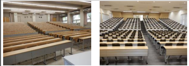
イス・机階段状固定タイプ