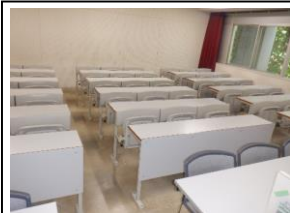
机・イス固定タイプ