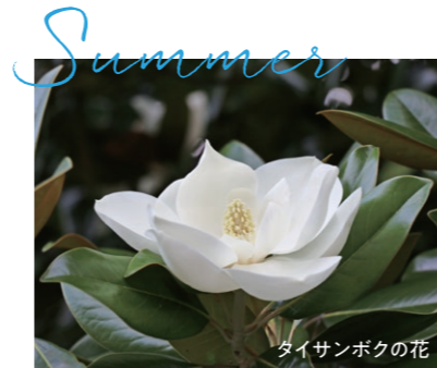
タイサンボクの花