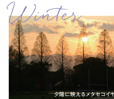
夕陽に映えるメタセコイヤ