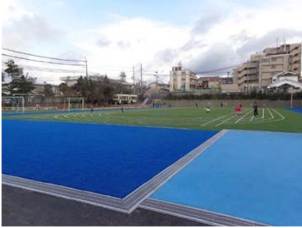
図 1 . 附属桃山小学校グラウンド