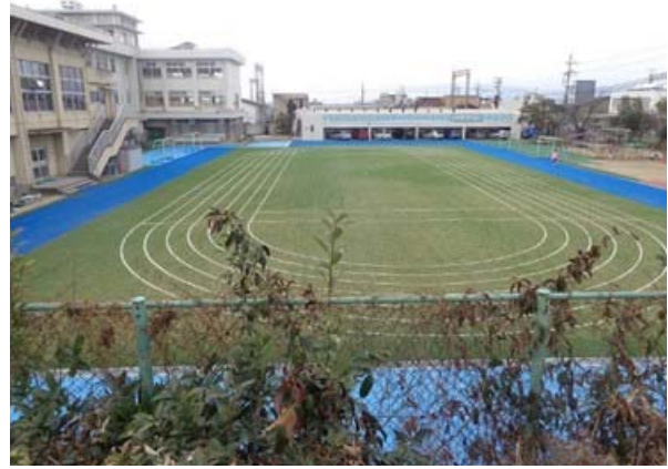
図 2 . 附属桃山小学校グラウンド