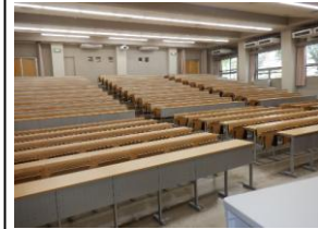
イス・机階段状固定タイプ

※ 施設使用料単価は光熱費(施設使用に伴う電気代、水道代、冷暖房費等の費用)を含みます。