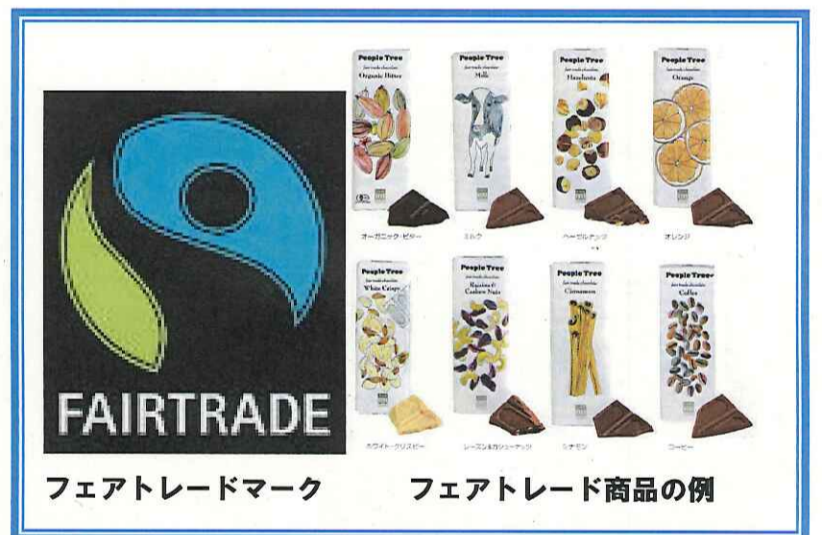
フェアトレードマーク

感想 フェアトレードで、発展途上国の人々を救えるというところが、いいなと思いました。子どもの低賃金労働など、これまで知らなかったことが分かるようになりました。