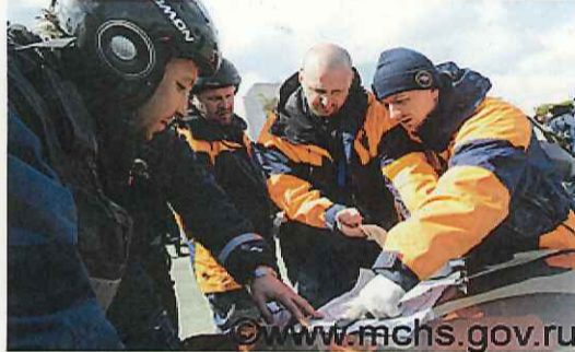
現場で作業に関する打合せを行うロシアの隊員たち