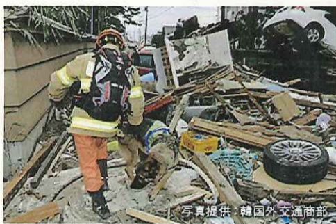
救助犬とともに行方不明者を捜索する韓国隊員

★3月22日の時点で670以上のNPO等からの支援の申し入れや見舞いの言葉があった。